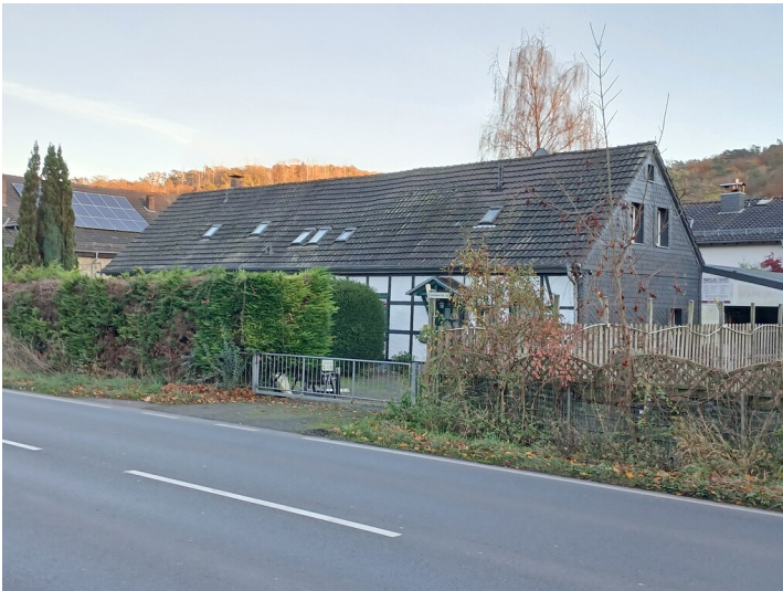
Hinter einem tiefen Vorgarten zurückgesetzte Nordseite eines eingeschossigen Fachwerk-Arbeiterwohnhauses der Immekeppeler Hütte (2024).