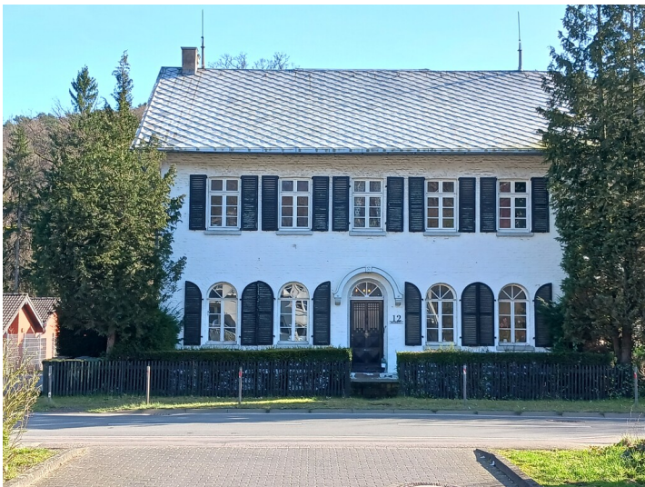
Die repräsentative Direktion der Immekeppeler Hütte: Ein zweigeschossiges Backsteinhaus mit fünfschiger Fassade, rundbogigen Fenstern im Erdgeschoss und einem Eingangsportal in der Mitte. Im Obergeschoss hat das Gebäude rechteckige Fenster, Schlagläden und ein flaches Zinkdach mit Blitzableitern an beiden Firstenden (2024).