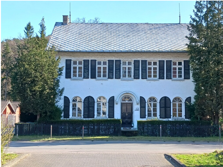
Die repräsentative Direktion der Immekeppeler Hütte: Ein zweigeschossiges Backsteinhaus mit fünfachsiger Fassade, rundbogigen Fenstern im Erdgeschoss und einem Eingangsportal in der Mitte. Im Obergeschoss hat das Gebäude rechteckige Fenster, Schlagläden und ein flaches Zinkdach mit Blitzableitern an beiden Firstenden (2024).