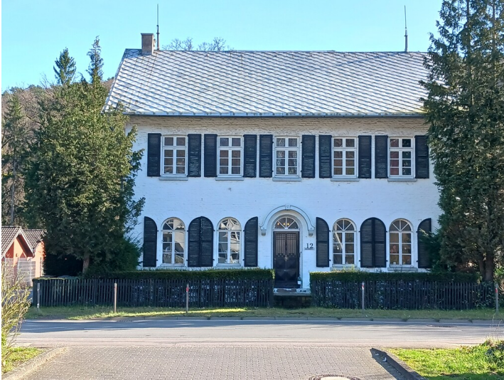
Die repräsentative Direktion der Immekeppeler Hütte: Ein zweigeschossiges Backsteinhaus mit fünfschiger Fassade, rundbogigen Fenstern im Erdgeschoss und einem Eingangsportal in der Mitte. Im Obergeschoss hat das Gebäude rechteckige Fenster, Schlagläden und ein flaches Zinkdach mit Blitzableitern an beiden Firstenden (2024).