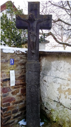
Gesamtaufnahme (2018)