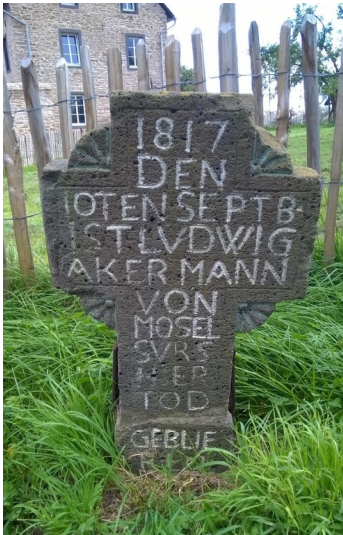
Basaltkreuz von 1817 an der K 42 - Ortseingang Mörz (2017)