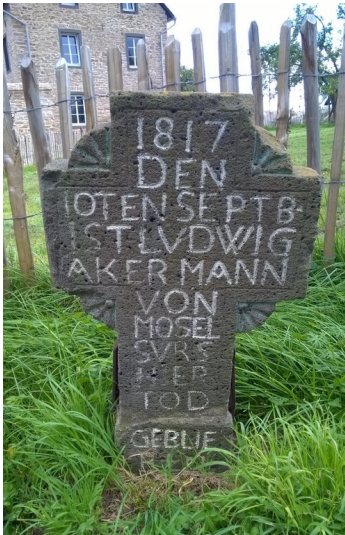
Basaltkreuz von 1817 an der K 42 - Ortseingang Mörz (2017)