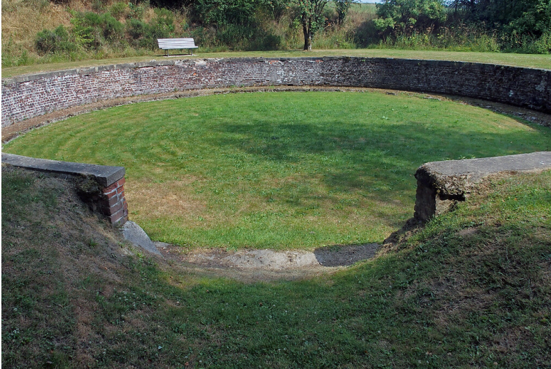
Ehemalige Lokomotiven-Drehscheibe bei Born (2022)