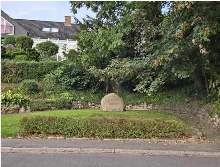
Gedenkstein in Holtsee (2024)