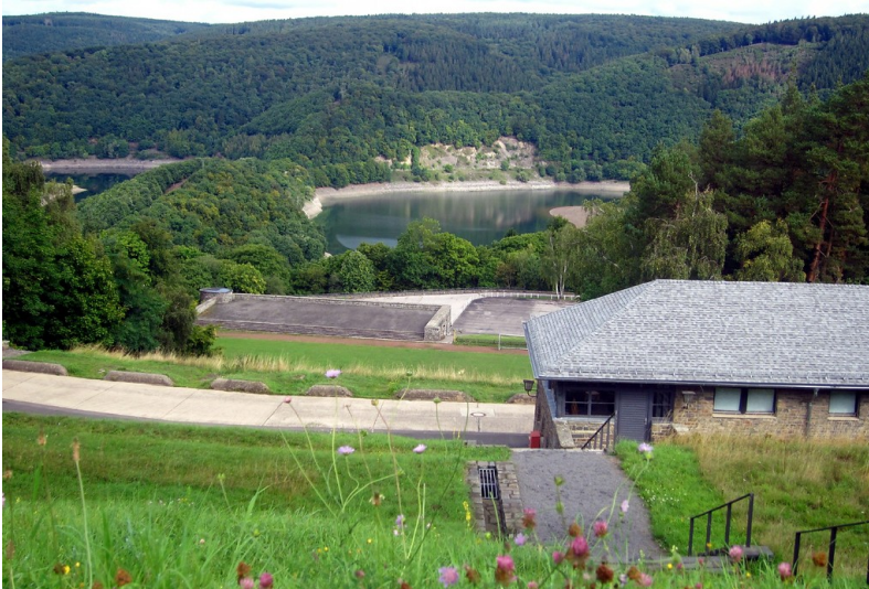
Blick über die Sportanlagen des NS-Schulungsheims, der so genannten "Ordensburg" Vogelsang bei Schleiden-Gemünd, auf den dahinter liegenden See der Urftalsperre (2015).