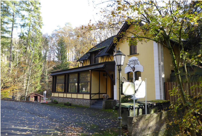
Gaststätte Jagdhaus im Schmelztal Jagdhaus im Schmelztal in Bad Honnef (2022).