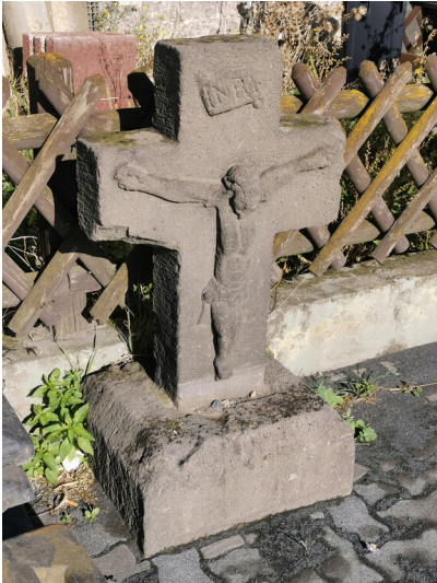
Wegekreuz an Bundesstraße 18 in Thür (2024)