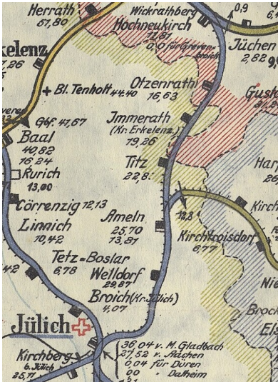
Bahnstrecke Hochneukirch - Jülich (1917)