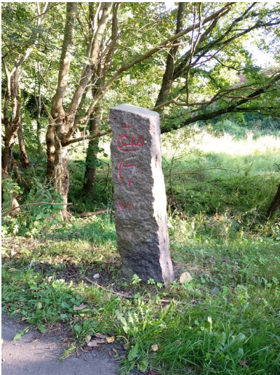
Historischer Jagdstein bei Norderbrarup (2024)