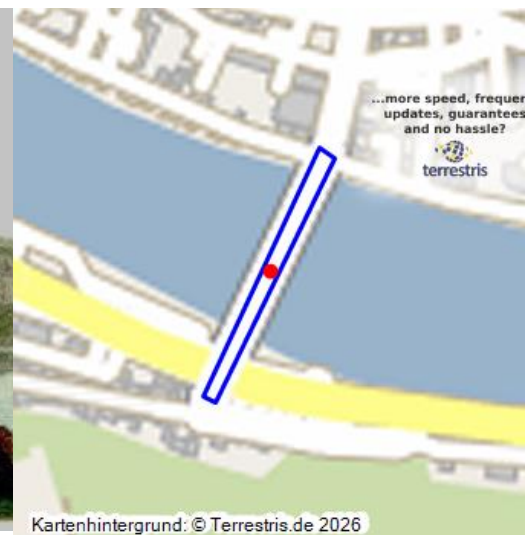
Brücke über die Mosel mit Brückentor (1898)