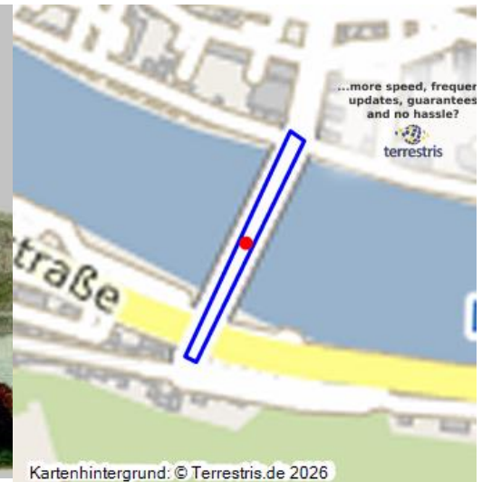
Brücke über die Mosel mit Brückentor (1898)