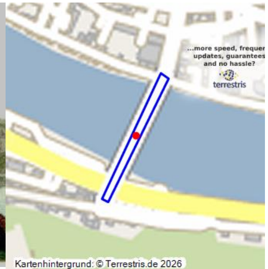
Brücke über die Mosel mit Brückentor (1898)