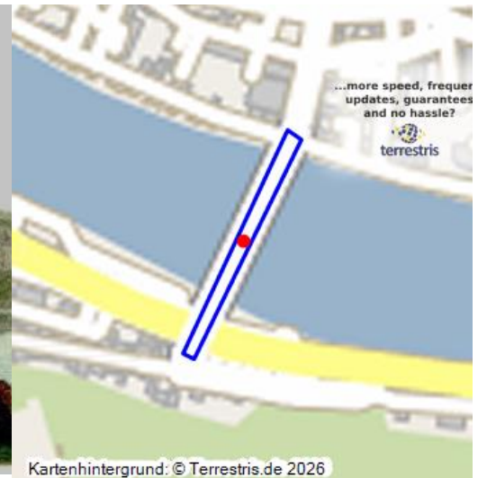
Brücke über die Mosel mit Brückentor (1898)