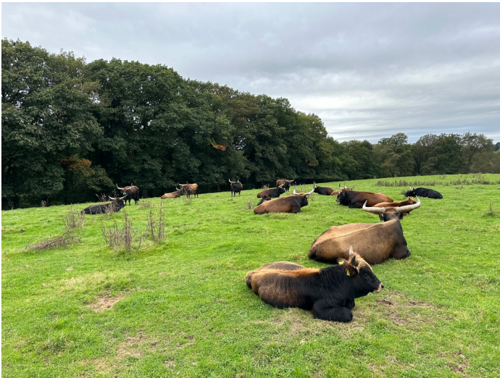
Heckrinder im Eiszeitlichen Wildgehege im Neandertal (2024).