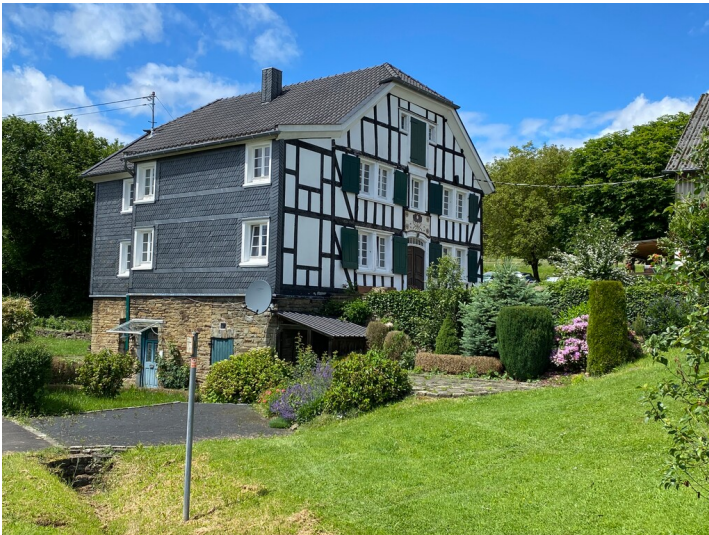
Historisches Fachwerkgebäude im Ortskern von Hochstraßen (2024)