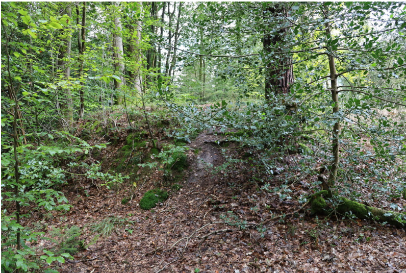
Galgenhügel der Grafherrschaft zu Homburg bei Abbenroth (2024)