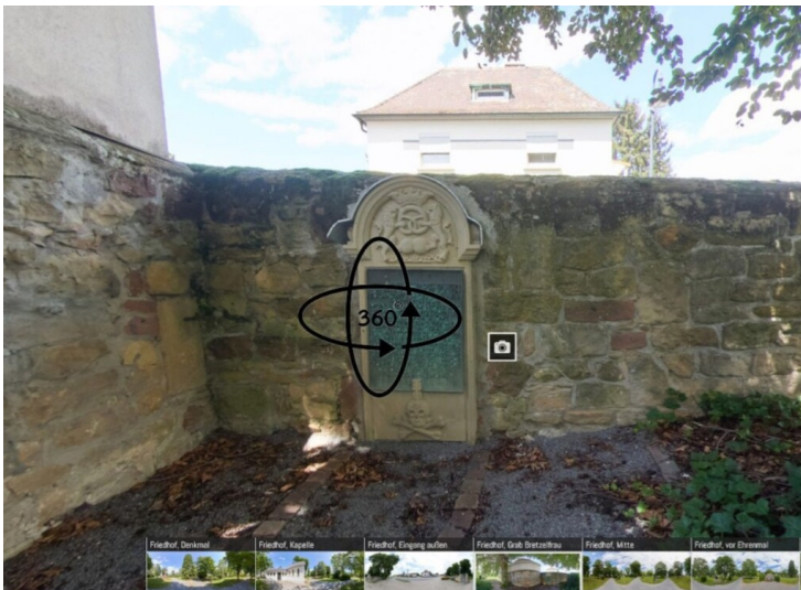
360-Grad-Ansicht des Grabmals der Brezelfrau auf dem Alten Friedhof Mutterstadt (2024)