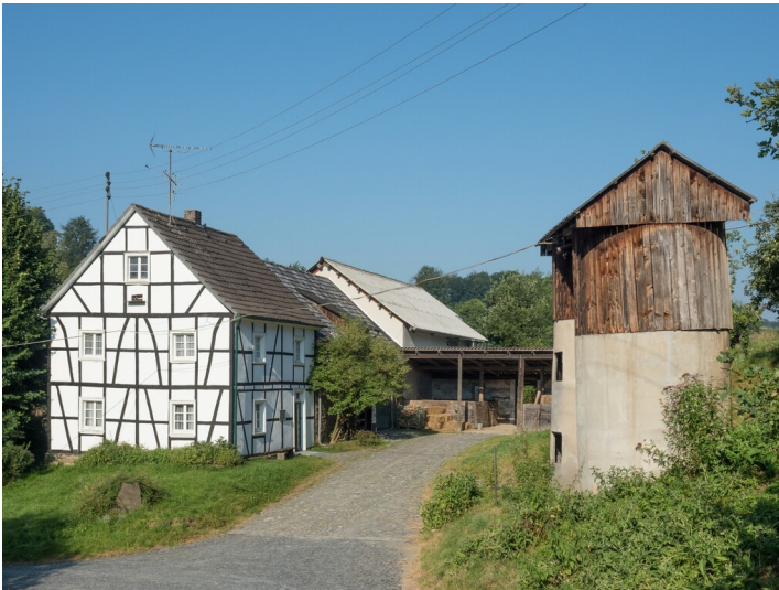
Hof Peters im LVR-Freilichtmuseum Lindlar (2024).