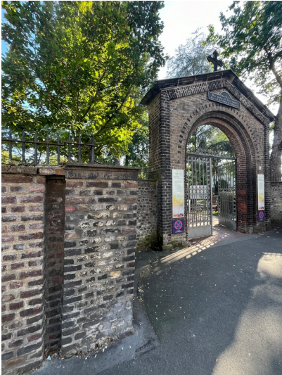
Eingangportal des evangelischen Friedhofs in Köln-Mülheim mit einer Tafel im Giebel (2024).