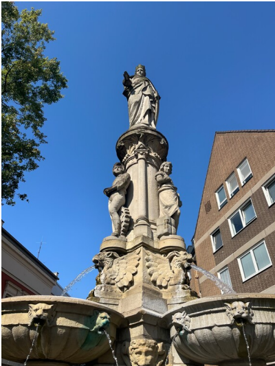
Historischer Stadtbrunnen Mülheim des Bildhauers Wilhelm Albermann von 1884 an der Ecke Mülheimer Freiheit und Krahenstraße in Köln-Mülheim (2024).