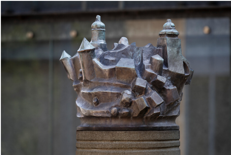
Der Künstler Petr Novák verewigte 1993 die Städtepartnerschaft zwischen Hilden und Nové Mesto nad Metují in einer Skulptur aus Sandsteinstelen. Die kleine Stadt aus Bronze sitzt wie eine Krone auf der zentralen Sandsteinsäule. Fotograf/Urheber: Rainer Hotz