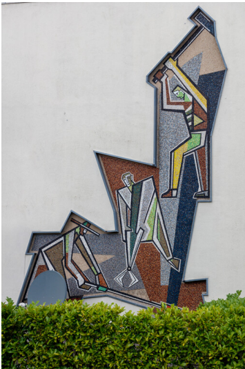
Die circa sechs Meter hohen Wandmosaiken an der Beethovenstraße wurden 1957 von Leonhard Nienartowicz geschaffen (2024).