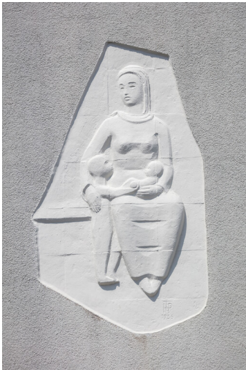
Wandrelief von Hans Peter Feddersen an der Giebelseite von Hausnummer 2 am Albert-Schweitzer-Weg (2024).