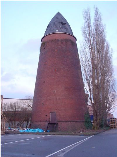
Der Winkelturm in Köln-Niehl, ein im Jahr 1940 erbauter Luftschutzturm der Bauart "Winkel" an der Neusser Landstraße (2001).