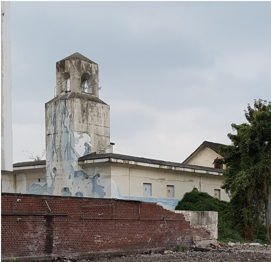
Der "Kirchenbunker" am Großmarkt in Köln-Raderberg, ein 1942/43 erbauter Hochbunker (2016).