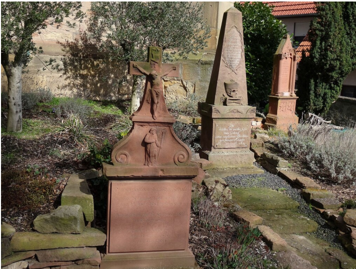
Die drei historischen Gräber der Herxheimer Pfarrer auf dem erhalten gebliebenen Teil des Kirchhofs an Sankt Maria Himmelfahrt in Herxheim bei Landau (Pfalz) (2024)