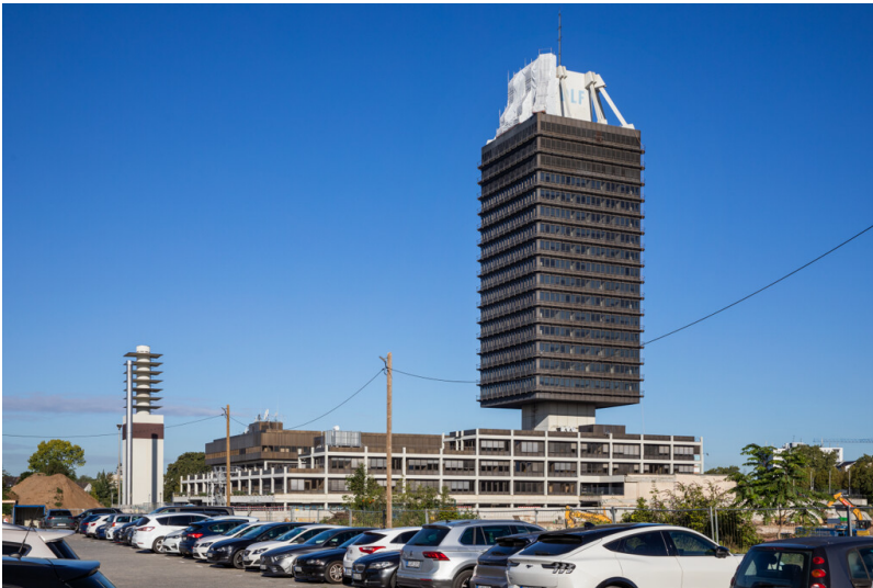
Köln-Marienburg, Deutschlandfunk