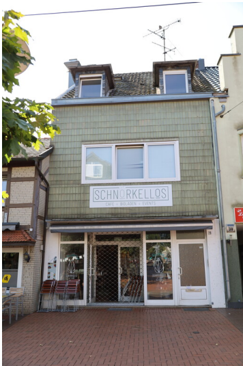
Geschäftshaus mit Keramikplatten der Köln-Frechener Keramik (2024)