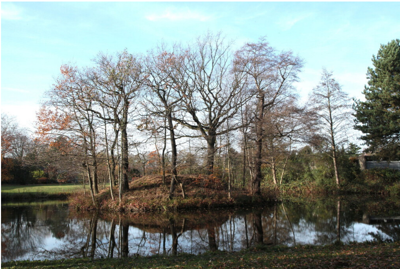
Teich beziehungsweise umgebender Graben und erhaltener Burghügel der Motte Kurtekotten am Knochenbergsweg in Köln-Flittard bei Leverkusen (November 2014).