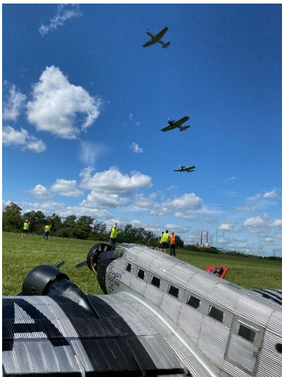
Vorbeiflug von historischen Maschinen während des Flugplatzfests 2023 auf dem Flugplatz Leverkusen, im Vordergrund eine Junkers Ju 52 ("Tante Ju").