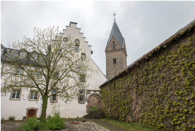
Mechernich-Kallmuth. Blick gegen Nordosten auf Burg Kallmuth des 16. Jahrhunderts mit dem markanten Treppengiebel, dahinter der Turm der Pfarrkirche.