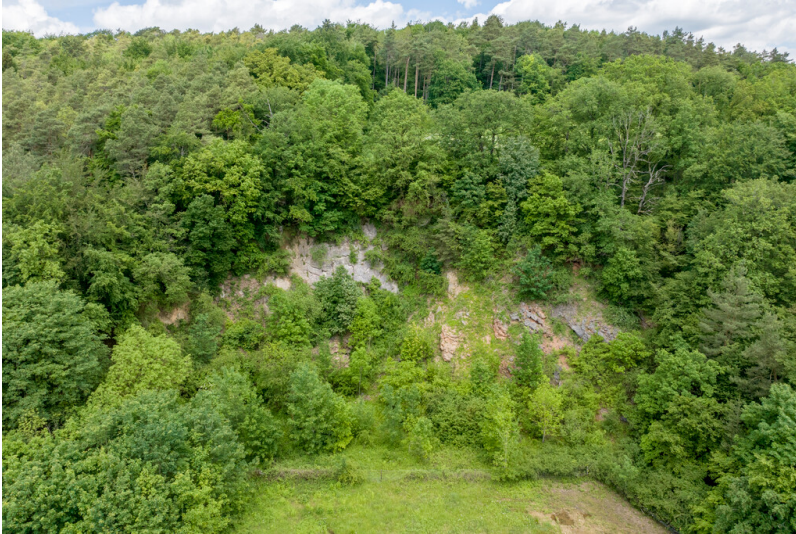
Nettersheim-Pesch. Blick gegen Norden auf den ehemaligen Steinbruch Paulsgraben mit der vorgelagerten Wiese.