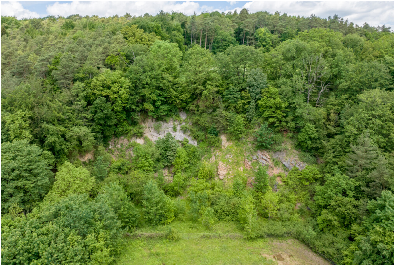
Nettersheim-Pesch. Blick gegen Norden auf den ehemaligen Steinbruch Paulsgraben mit der vorgelagerten Wiese.