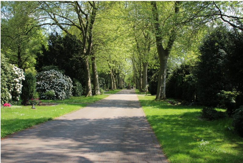
Allee auf dem Westfriedhof in Oberhausen (2022).