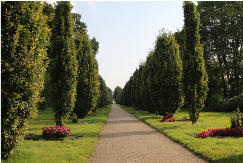
Allee mit Säuleneichen auf dem Hauptfriedhof in Mülheim an der Ruhr (2021).