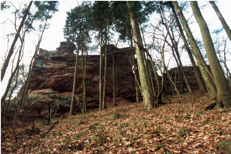
Felsmassiv von Osten (2001)