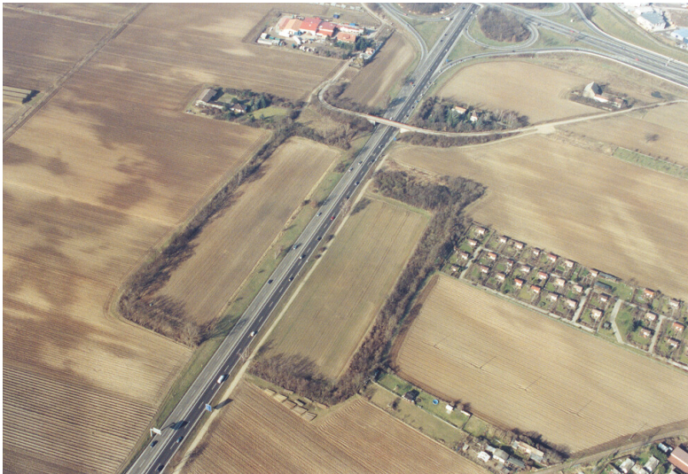
Luftbild von der Burgstelle Hüttengraben (2001)