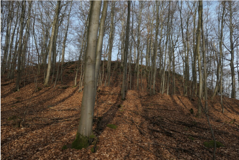
Dielkopf mit Ringwall (2023)