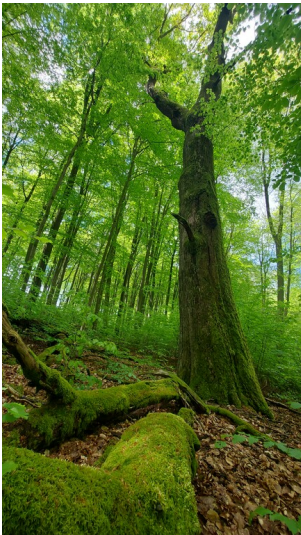
Alte Überhalteiche bei Welschneudorf (2024)