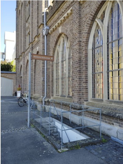
Der Eingang zur römischen Bäderanlage auf dem Parkplatz des Collegium Albertinum an der Adenauerallee in Bonn (2024).