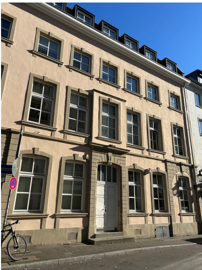
Die Fassade des denkmalgeschützten Gebäudes Neubrücke 12 in der Düsseldorfer Altstadt, 1967-1976 der "Club Creamcheese" (2024).