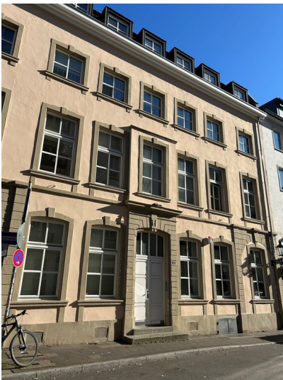
Die Fassade des denkmalgeschützten Gebäudes Neubrückestraße 12 in der Düsseldorfer Altstadt, 1967-1976 der "Club Creamcheese" (2024).