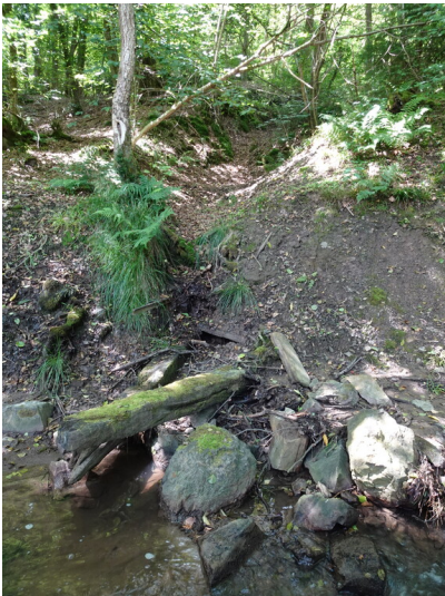
Das verstürzte Mundloch des tiefen Ehrenfeldstollens direkt am Volbach ist noch als Geländemulde (Pinge) deutlich sichtbar (2024).