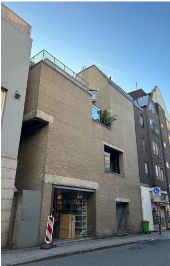
Fassade des Galeriehauses "Schmela Haus" von Aldo van Eyck in der Düsseldorfer Altstadt, Mutter-Ey-Straße 3 (2024)