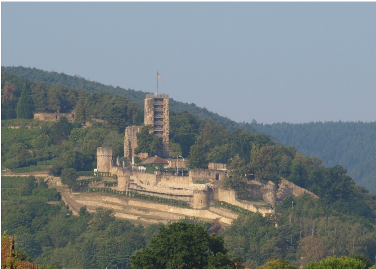
Gesamtansicht von Südost