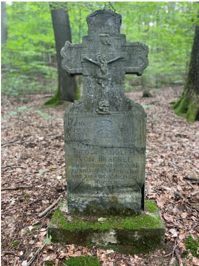
Kreuz von Theodor A. von Brackel zu Breidmar bei Hammerstein im Kaltenbachtal (2024)

Schlagwörter: Gedenkkreuz Fachsicht(en): Landeskunde Gemeinde(n): Hammerstein Kreis(e): Neuwied Bundesland: Rheinland-Pfalz