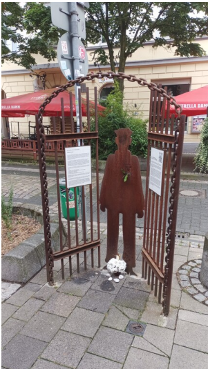
Erinnerungszeichen an das Bestehen des Außen-KZ Deutsche Erd- und Steinwerke in der Kirchfeldstraße in Düsseldorf-Friedrichsstadt (2024).