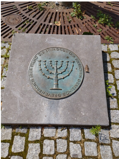
Gedenktafel für die jüdische Gemeinde und ihre Synagoge am Synagogenplatz in Grevenbroich (2024).