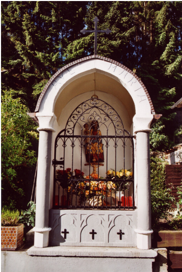
Bildstock mit der Madonna aus der Kehr in Rheinbrohl, Gesamtansicht (2002)