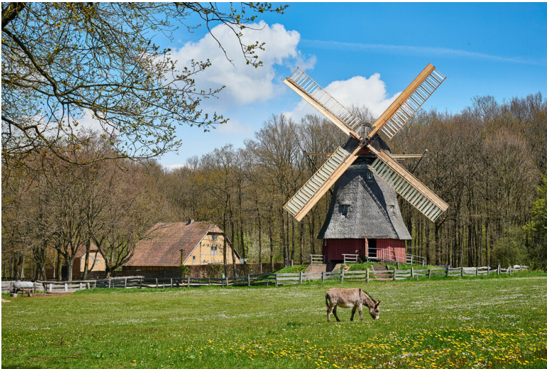
Ansicht der Baugruppe Niederrhein im LVR-Freilichtmuseum Kommern (2016).