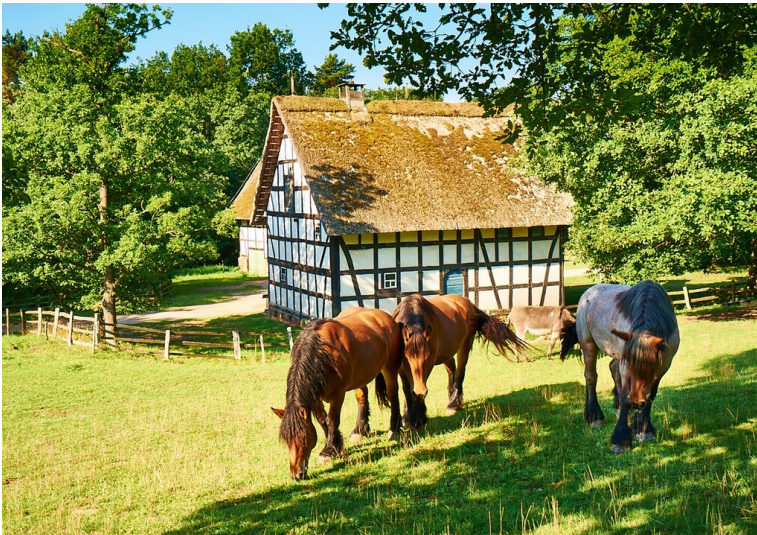
Ansicht der Baugruppe Eifel im LVR-Freilichtmuseum Kommern (2015).