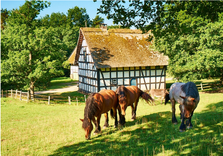
Ansicht der Baugruppe Eifel im LVR-Freilichtmuseum Kommern (2015).